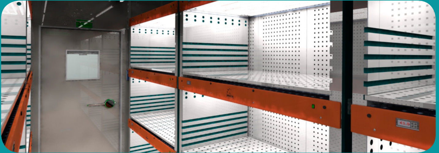
poly klima Raum mit phyto-photon Lichtregalen LR-A